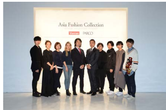
2017年2月11日 NY・ファッション・ウィーク