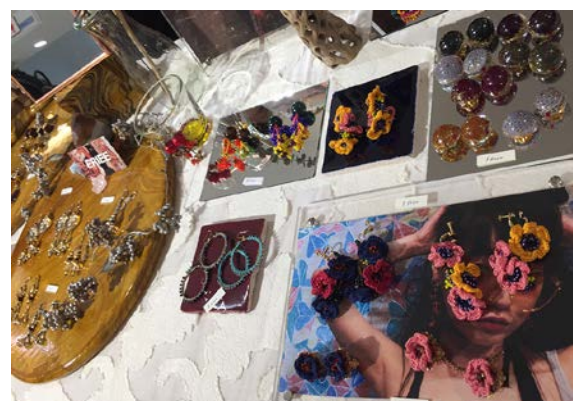
2017年4月9日～4月16日 池袋パルコ SHOP・販売