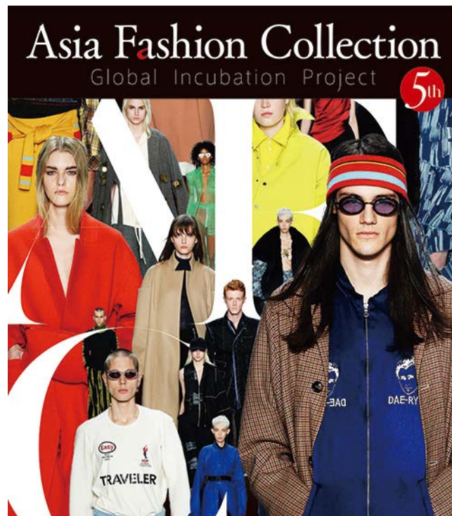
- AFC 5th (2017-2018) キーヴィジュアル -

今回は、オリジナルテキスタイルサポートに関しては審査段階からテキスタイルメーカーとのマッチングを行い、審査作品から提供を受けられるようにし、さらに最終選考者のブランドオリジナル WEB サイト制作を新たに実施致します。今後もこの様なブランド事業化に向けた支援プログラムをさらに強化していきます。