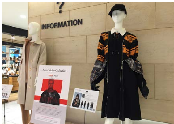
2017年4月3日～4月16日 池袋パルコ作品展示