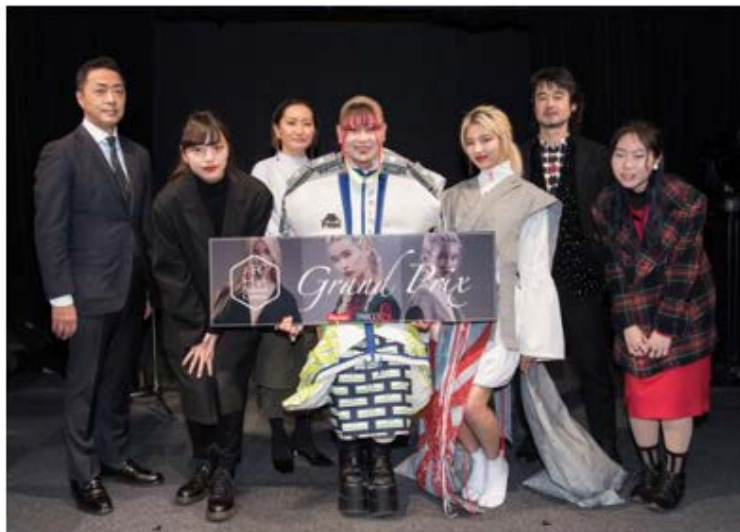
- 『AFC High School Contest』左) ロゴ 右) 審査員と受賞した高校生たち -

今回初の『AFC High School Contest』の応募テーマは、「2018年あなたが着たいオリジナルスタイリング」。二次審査を通過した3名より、グランプリとセミグランプリが決定しました。受賞した3名の作品は、4月20日（金）～4月22日（日）池袋 PARCO で展示されます。