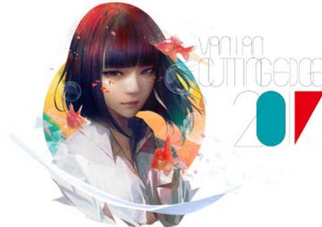
-VANTAN CUTTING EDGE 2017 のキービジュアル-

HP: http://www.vantan.com/special/ce2017/