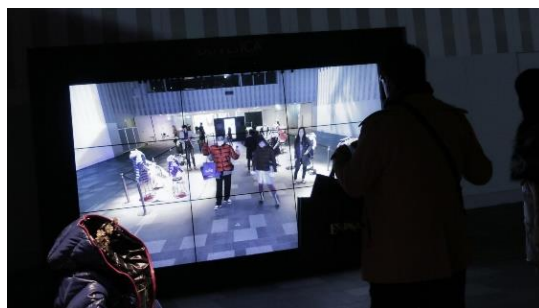
- IGREK DESIGN によるデジタルファッションプロモーションの事例 左: 会場内マッピング、右: デジタル試着 -