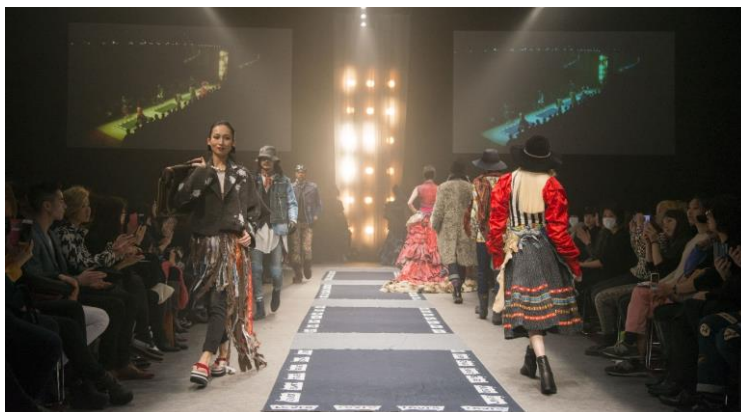
- 昨年の卒業修了制作展「VANTAN STUDENT FINAL 2015」でのスタイリングショーの様子 -

“SOURCE OF LIFESTYLE”をテーマにした世界で愛され続けている靴とともに、新しいライフスタイルを提案するプロモーション & ファッションショーや、ブランドの可能性と汎用性を追及した新たなスタイルを発信するスタイリングショー、ライフスタイルにフォーカスして日常的な 1 シーンを切り取り、スタイリングに落とし込むスタイリングショーの 3 つのショーを実施します。