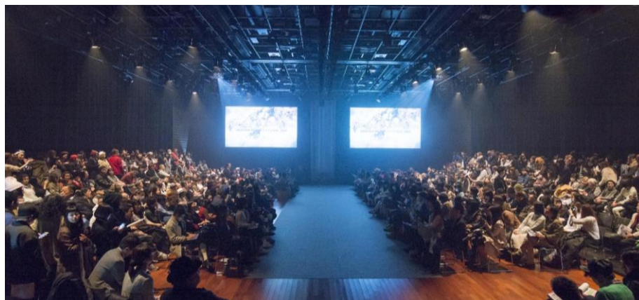
－ 上: ショーコンテンツ アタック映像3D イメージ 会場の壁3面を使用したプロジェクションマッピングの中でショーを実施 下: 昨年の卒業修了制作展のショー会場の様子