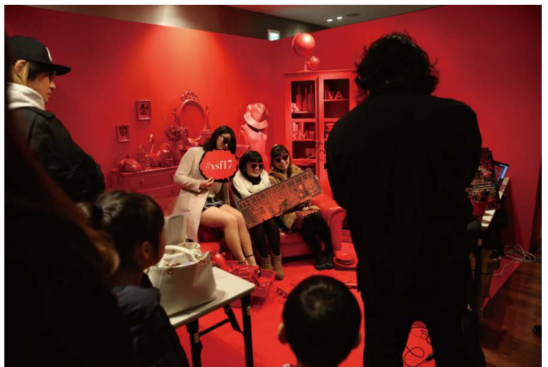
-左: バンタン卒業修了制作展『VANTAN STUDENT FINAL 2017』キービジュアル/ 右: 同イメージでの撮影スペース-