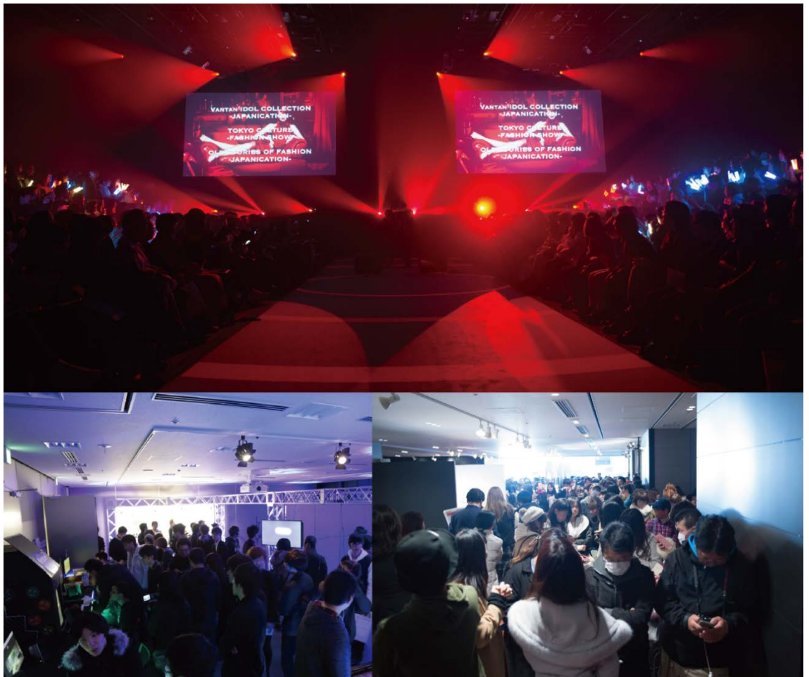
-イベントの様子(会場: EBIS303) ①-

学生たちは、これまでに培ってきた感性や知識、技術、経験などを活かし、集大成となる“デザインのチカラ”を、ショーや展示、販売ブースなどで表現、イベントに来場した約3,000名の観客に向けて発信致しました。