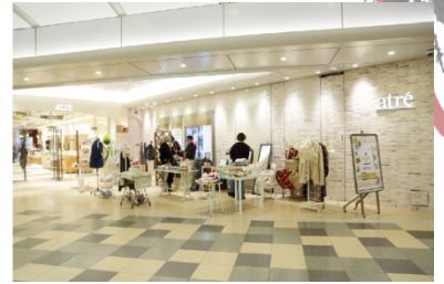
-アトレ恵比寿でのSHOPの様子-