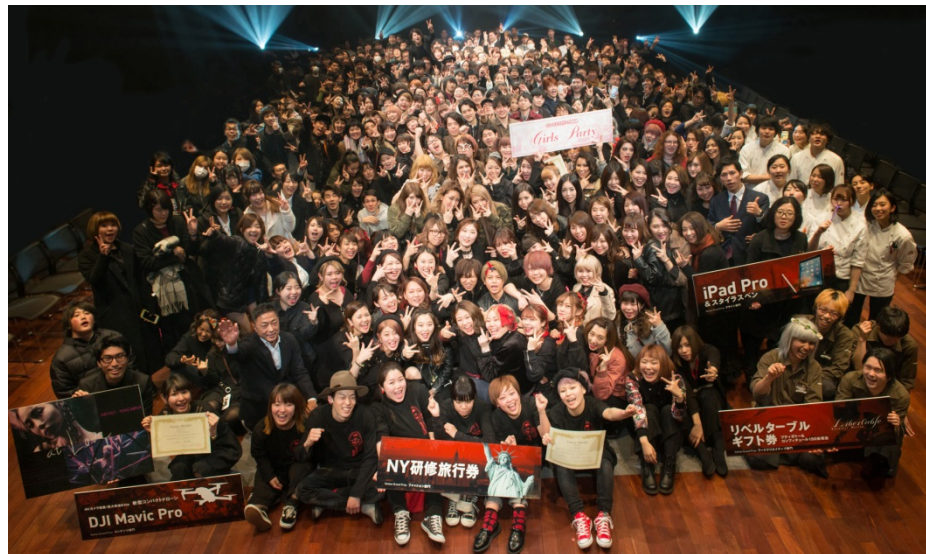
- 表彰式後の全体集合写真 -

特設 Twitter: https://twitter.com/vantansf