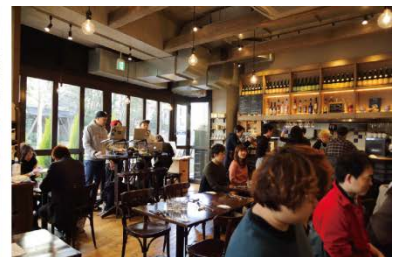
-BREIZH Café CRÉPERIE Le Comptoirでのイベントの様子-