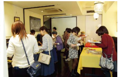
-天現寺大使館でのイベントの様子-