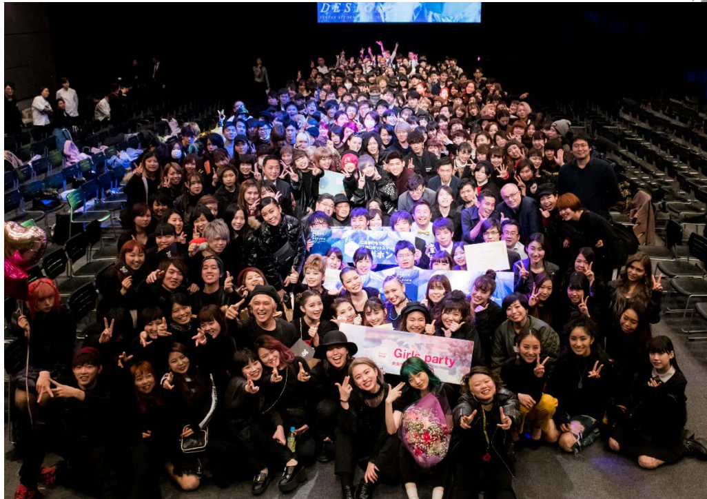
- 表彰式後の集合写真 -