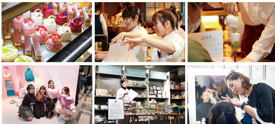
- 店舗の様子 -