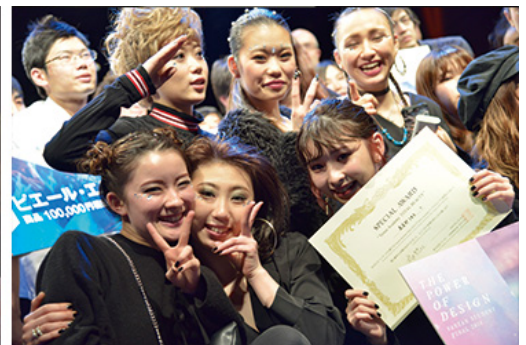
- 表彰式の様子 -