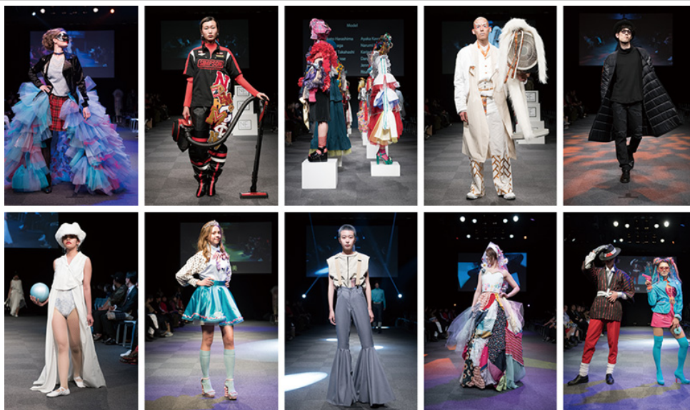
- ショーコンテンツの様子 -