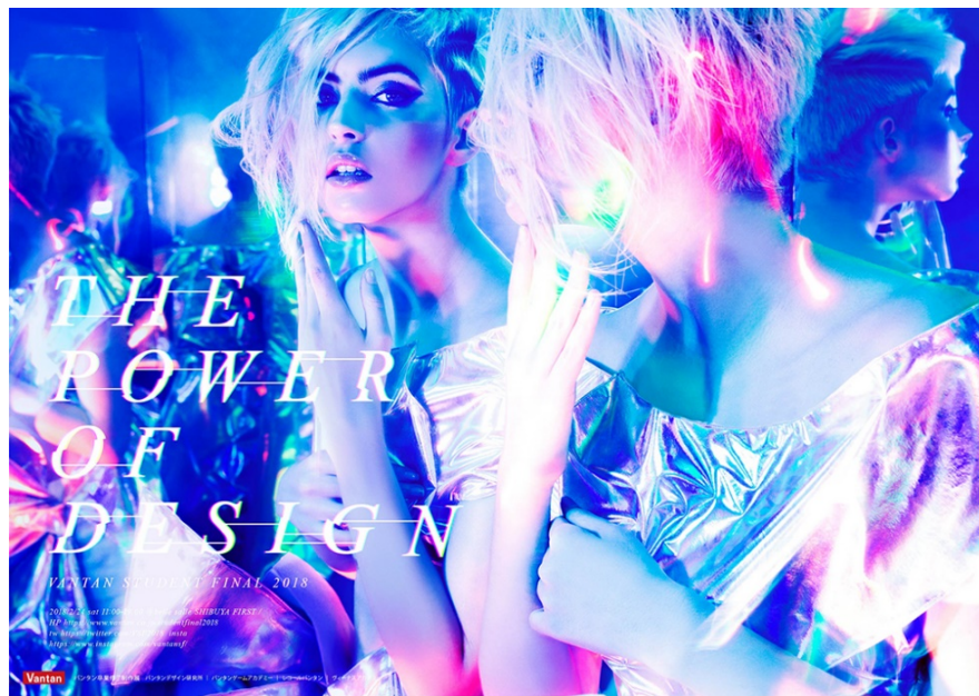
- バンタン卒業修了制作展『VANTAN STUDENT FINAL 2018』キービジュアル -