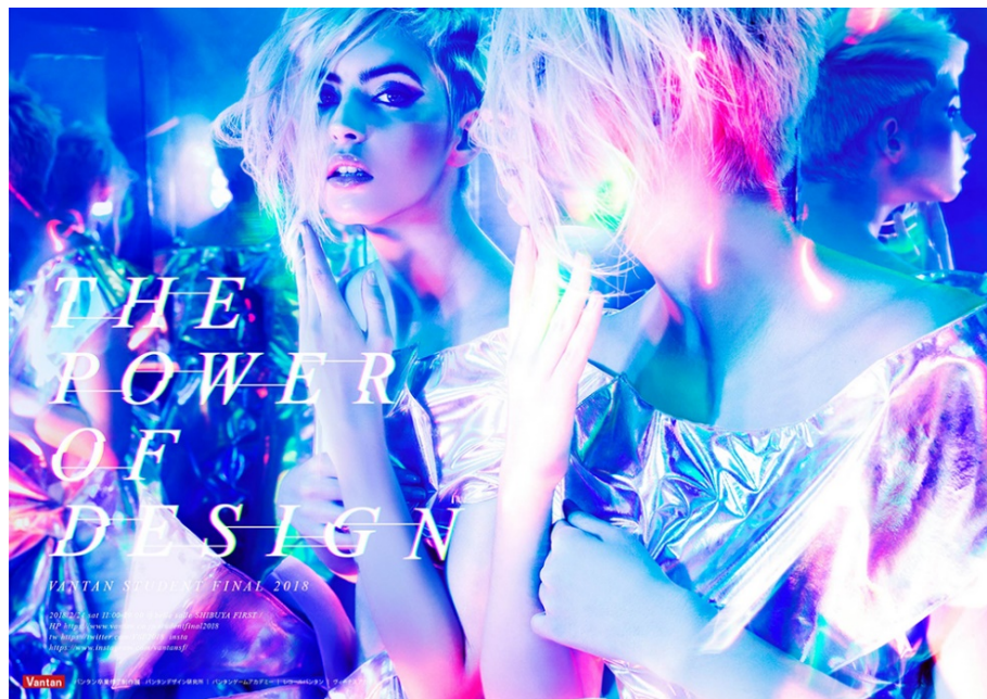
- バンタン卒業修了制作展『VANTAN STUDENT FINAL 2018』キービジュアル -