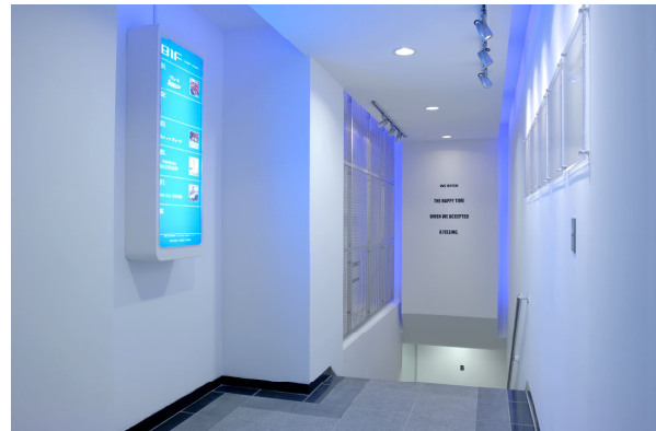
His works : the event in French Embassy / Bar at Yokohama