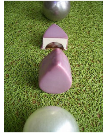
Images of the Food Design part.