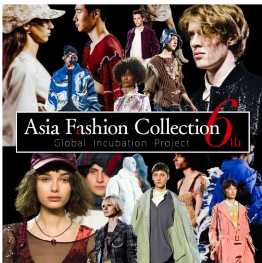
- AFC6th キービジュアル -

株式会社バンタン（本部：東京都渋谷区）と株式会社パルコ（本部：東京都渋谷区）が主催するインキュベーションプロジェクト“Asia Fashion Collection 6th（アジアファッションコレクション以下、AFC）は、日本・韓国・台湾・タイを代表する若手11ブランドが参加するランウェイショー「AFC 東京ステージ」を10月14日（日）に東京・恵比寿にて開催。ニューヨーク・ファッション・ウィーク（以下、NYFW）に参加する日本代表ブランドを決める最終審査も実施し、NYステージ出場ブランドが決定いたします。ショー開催後には、メディア・バイヤー向けの交流会も実施いたします。